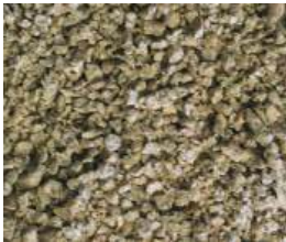
Granulat TX = CG