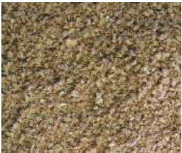
Griess TX = SA

Die Futter sind in folgender Struktur erhältlich