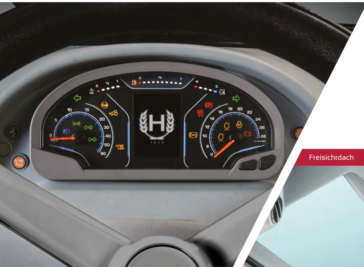
InfoCentre+ mit LCD-Display und zwei Instrumenten